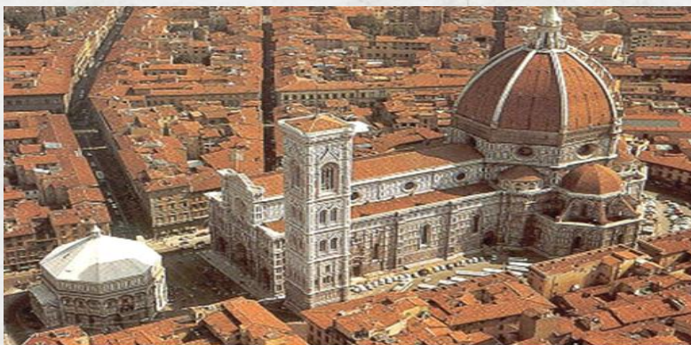
Pohled z ptačí perspektivy, vlevo baptisterium Jana Křtitele, ve středu Giottova zvonice, za ní bazilika Santa Maria del Fiore. Nalevo vstupní portál, napravo kupole s lucernou.

Průčelí katedrály bylo dokončeno v letech 1875 - 1887 v novogotickém stylu. Aby se dodržel historický vzhled katedrály, byly použity stejné barvy mramoru: bílý z Carrary, zelený z Prata a růžový z Maremy. Štít nad středním vstupem zdobí Madona, obklopená vlasy Apoštolů. Duomo je dlouhý 160 m, 43 m široký, příčná loď je dlouhá 91m. Výška průčelí je 50m, kdežto kopule má 114,4 m. Celková plocha je 8 300 m 2 a interiér může pojmut až 25 tisíc lidí. Dominantou baziliky je její cihlová kupole, jejíž rozpětí činí 41,97 m. To znamená, že je třetí největší stavbou svého druhu na světě (rozpětí kupole svatopetrské baziliky v Římě je o 60 cm širší, základna kupole Pantheonu činí 43,22 m). Po 463 schodech lze vystoupit do tzv. lucerny kopule, odkud se naskýtá jedinečný pohled na panorama města.