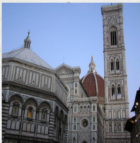
Pohled z poněkud omezené perspektivy turisty, volně stojícího v levém dolním rohu horního obrázku, ve stylu vše v jednom.

Průčelí katedrály bylo dokončeno v letech 1875 - 1887 v novogotickém stylu. Aby se dodržel historický vzhled katedrály, byly použity stejné barvy mramoru: bílý z Carrary, zelený z Prata a růžový z Maremy. Štít nad středním vstupem zdobí Madona, obklopená vlasy Apoštolů. Duomo je dlouhý 160 m, 43 m široký, příčná loď je dlouhá 91m. Výška průčelí je 50m, kdežto kopule má 114,4 m. Celková plocha je 8 300 m 2 a interiér může pojmut až 25 tisíc lidí. Dominantou baziliky je její cihlová kupole, jejíž rozpětí činí 41,97 m. To znamená, že je třetí největší stavbou svého druhu na světě (rozpětí kupole svatopetrské baziliky v Římě je o 60 cm širší, základna kupole Pantheonu činí 43,22 m). Po 463 schodech lze vystoupit do tzv. lucerny kopule, odkud se naskýtá jedinečný pohled na panorama města.