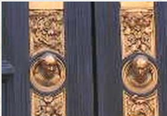
Zvětšený Ghilbertiho autoportrét - hlava vlevo